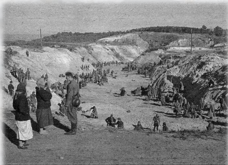
Babi Jar, 29./30. 9. 1941 – Erschießung von 33 771 jüdischen Menschen.

Бабий яр - место массовых расстрелов гражданского населения, главным образом евреев, цыган, а также советских военнопленных, осуществлённых немецкими оккупационными войсками и украинскими коллаборационистами в 1941 году. Всего было расстреляно свыше ста (или ста пятидесяти) тысяч человек. По мнению некоторых исследователей, в Бабьем Яру только евреев было расстреляно около ста пятидесяти тысяч человек (жителей Киева и других городов Украины). Из Бабьего Яра спаслось 29 человек